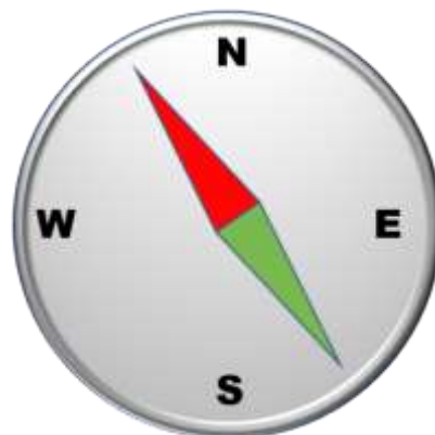
Magnetnadel ist ein magnetischer Dipol